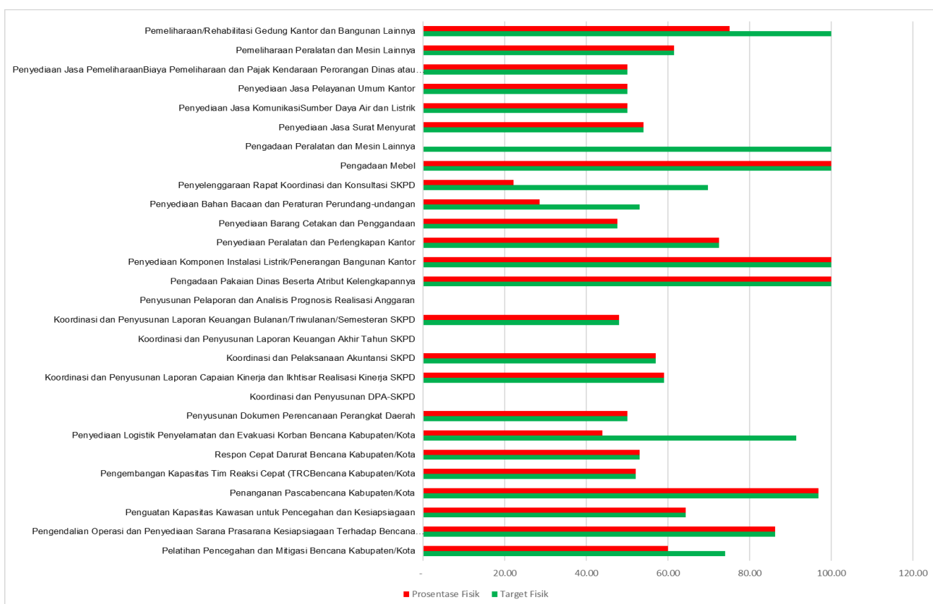
Perbandingan Target Fisik dan Realisasi Fisik Sub Kegiatan per Juni 2021